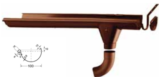
GRONDAIA "BOCCA" 10 cm TUBO PLUVIALE Ø 6 cm