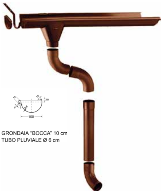
GRONDAIA "BOCCA" 10 cm TUBO PLUVIALE Ø 6 cm